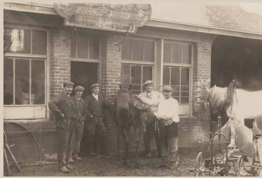
La maréchalerie d'Amand Clatot.

Les bourreliers, les maréchaux et les charrons forment tout au long du XIXe siècle un réseau dense d'artisans qui quadrillent en profondeur