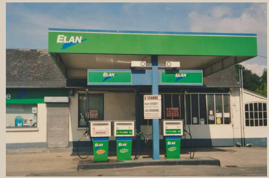
La station-service Elan est définitivement fermée.